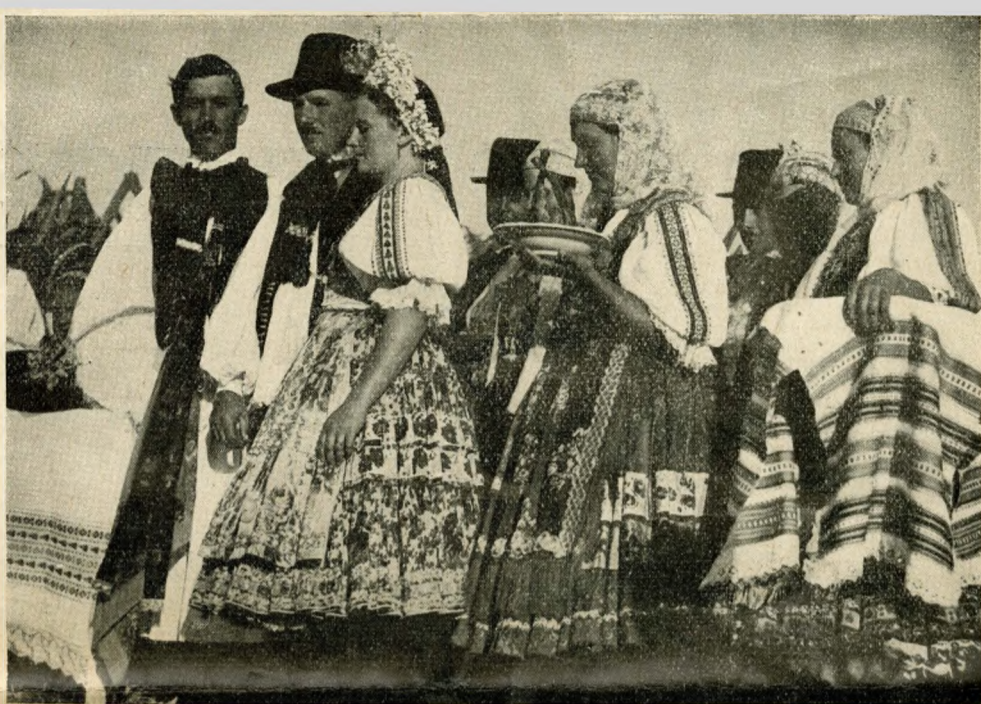
COSTUMES DES PAYSANS DE SARKÖZ

En Hongrie, le recul fut sensiblement moins grand qu'ailleurs. En 1933, le revenu du pays au titre du tourisme dépassait déjà celui de l'année 1929. L'Etat hongrois a retiré, du mouvement