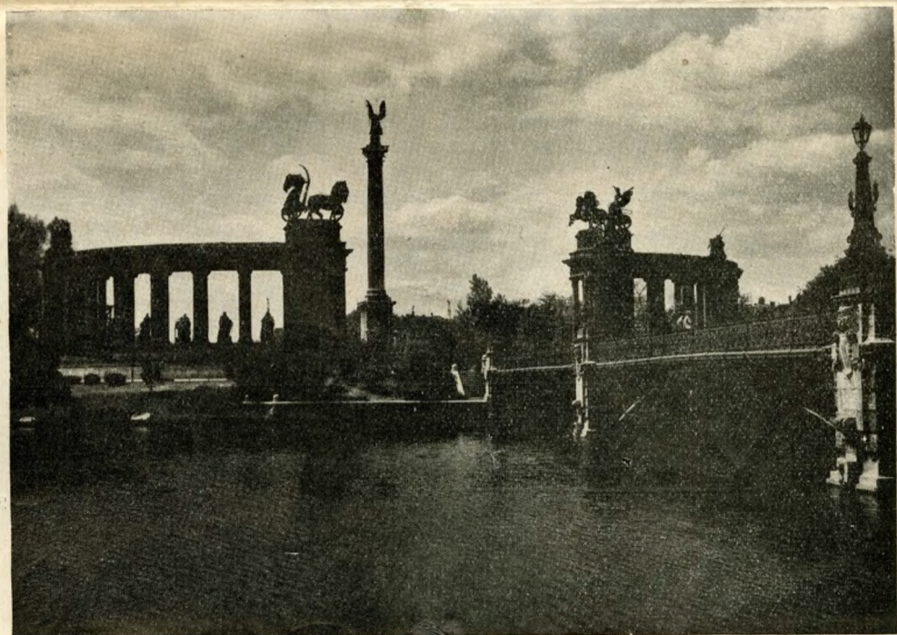
MONUMENT MILLÉNAIRE A BUDAPEST

l'Est, c'est un « autre monde » qui commence. Maintenant, c'est précisément pour cette raison que l'on continue le voyage dans la direction de l'Est. Les Hongrois répètent, non sans fierté, que celui qui a une fois passé chez eux, revient en Hongrie à plusieurs reprises. Ce fait véridique, constitue la meilleure garantie de l'essor touristique d'un pays.