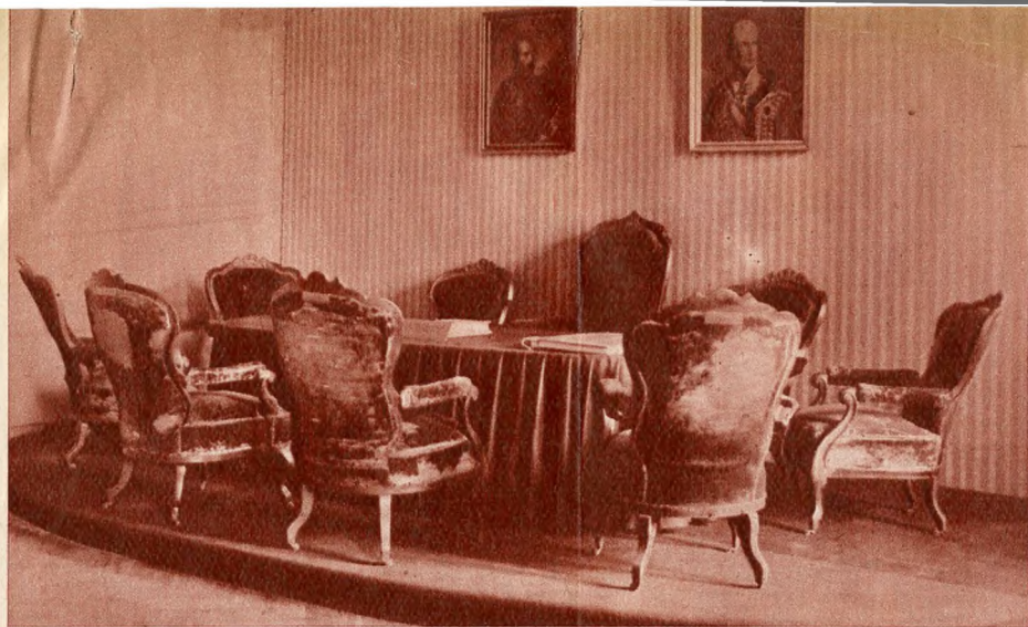
Az első felelős kormány székei a parlamenti múzeumban

fut körbe. Ha minden lámpát felgyujtanak, akkor körülbelül ezer villanykörte borítja nappali ragyogásba a pompás termet.