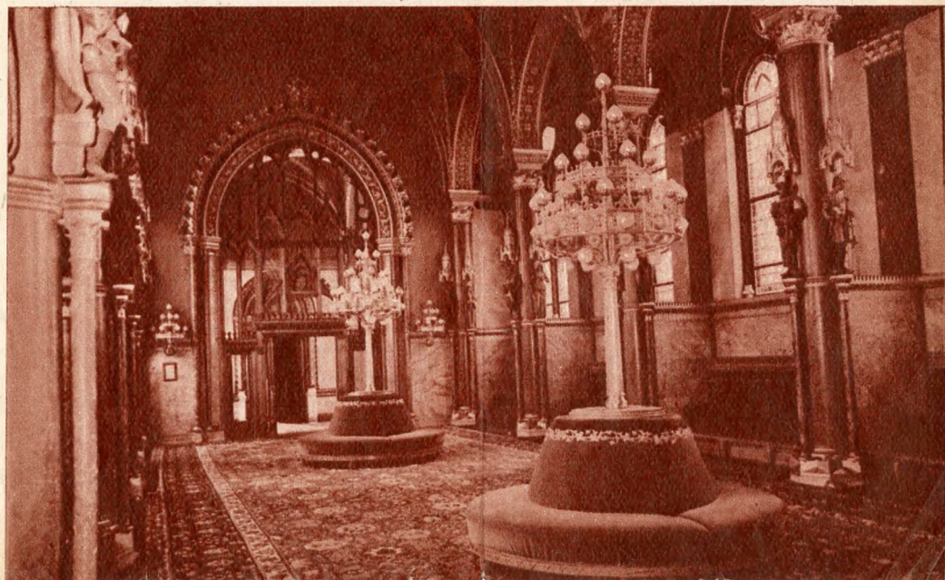
Társalgó a képviselőházban

A képviselőházban 438, a felsőház üléstermében 290 ülés hely van. Az üléstermek körül húzódó sok folyosót kb. egy kilométer hosszúságú 2.20 méter széles vörös plüss-szőnyeg fedés a szobák, termek, társalgók is mind kétujjnyi vastag süppedő nemes szőnyegekkel vannak fedve. Az üléstermekben és a folyosókon 108 villanyóra mutatja az időt. Több száz gótstílusú csillár tízezer villanykörtével világítja meg a dunaparti gót palota belsejét. A felhasznált vezeték olyan hosszú, hogy Budapesttől Bécsig el-