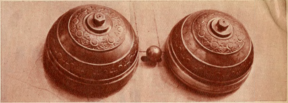
A híres „viharcsengő”

is csak orvosi táskájával járt be a Házba. Az akkori viharos napokban akadt is munkája elég. 1907-ben Justh Gyula elnök rendszeresítette a t. Ház orvosi állását, amelyet azóta is betöltöttek.