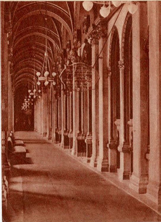
Folyosórészlet a képviselőházban

Százhatvanféle rendkívül értékes és csodálatos színhatású márványfajttával vannak borítva belül az üléstermek, a kupolacsarnok, a fölépcsőház, a nagyfolyosók, a delegációs és miniszteriális front, valamint az elnökségi és bizottsági termek. Az Országház belsejét az összes magyar foglalkozási ágakat jelképező 54 horgany-szobor (Zsolnay-féle), külsejét pedig 88 kőszobor díszíti. A képviselőház sokszögű üléstermének 11 ajtaja van. Minden ajtón drága, nehéz piros plüss-függöny. Tizenkét óriási ablak ontja a világosságot, éjjel pedig a fafaragású, rozettás mennyezetten öt csillár szikrázik. Az emeleti karzatok korlátján háromsoros villanygírland