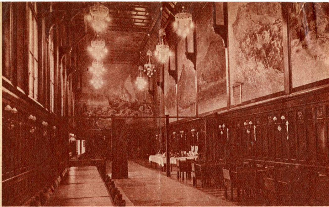
A parlament étkezőtermei

érne. Hatvankilenc platina-csúccsal ellátott villámhárító vigyáz a viharokra.