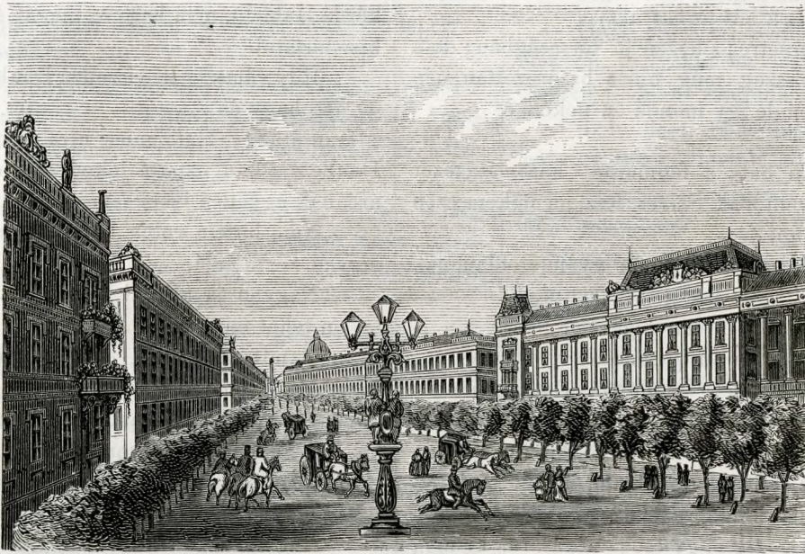
A tervezett boulevard látképe a város felé. (Szövege a múlt számunkban volt.)