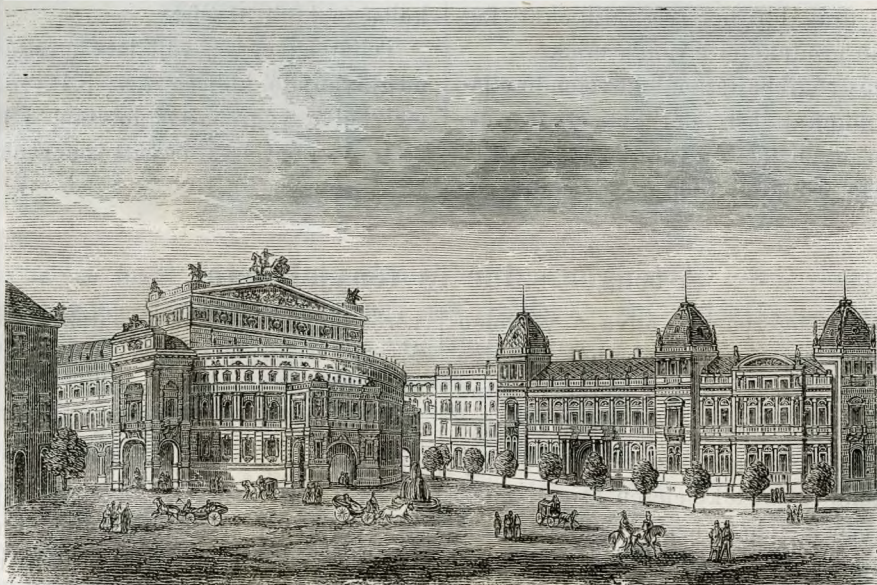
A tervezett operaház a boulevard váci uti sarkán.

A hét öl széles főkocsiút a most érintett mellékutal egyenlő alapzatot kap, 9" magasra alapkővekből, melyek 3" vastag kavicsolás által fedet-