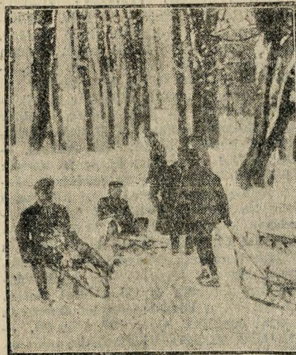
Ródlizók a Zugligetben

A Zugligetben teljesen egészen a Szent Anna-kápolnáig mindenütt száguldó ródlilikat kellett kikorűlni a felfelé igyek-