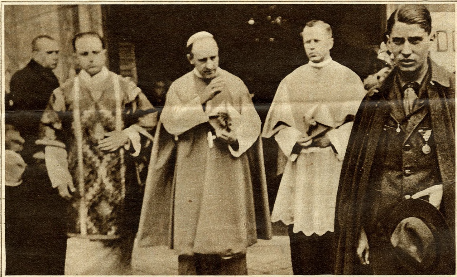
Rott Nándor veszprémi püspök a belvárosi templom kapujában.