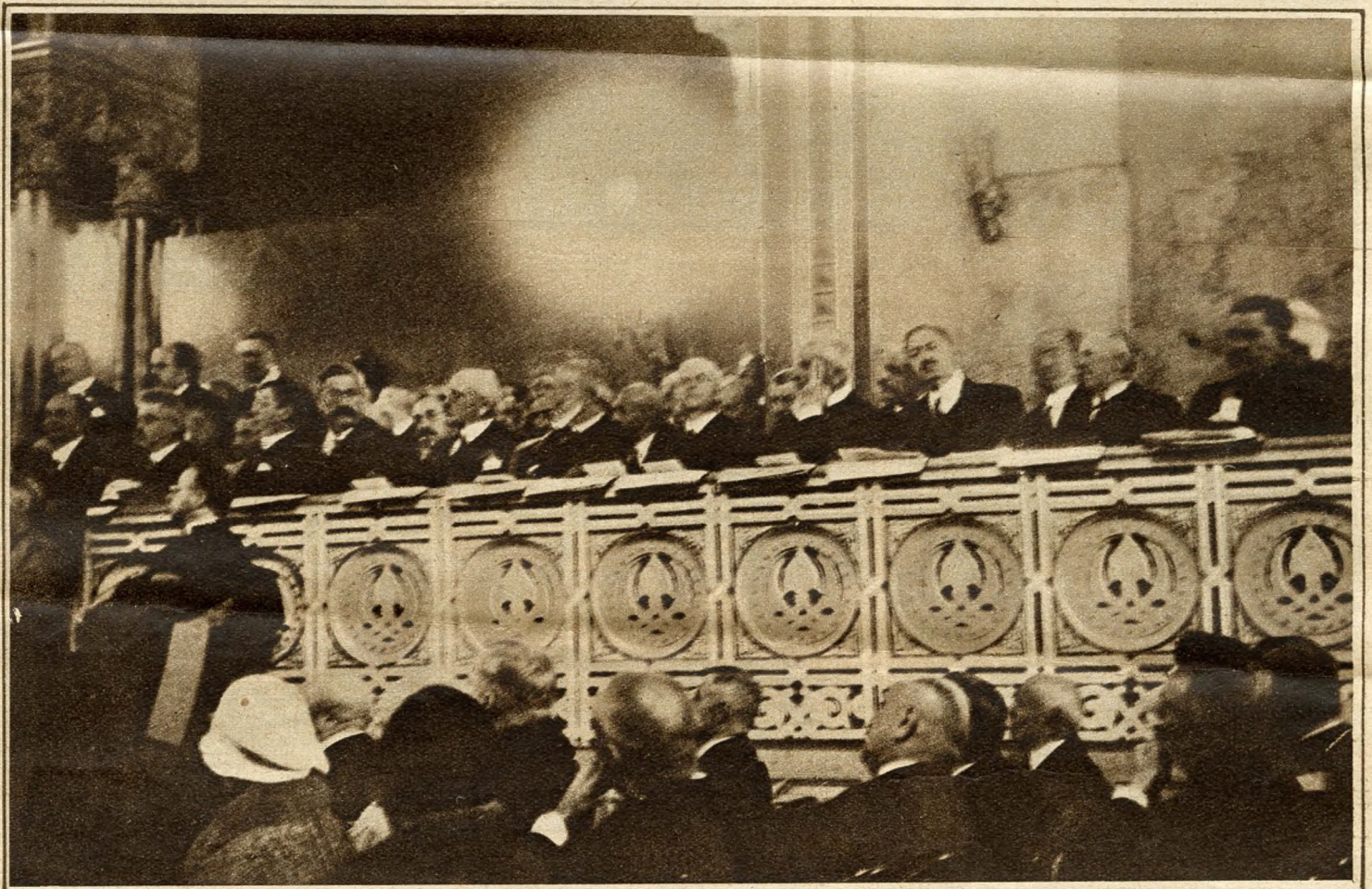
Megnyitőülés a Vigadóban: Miniszterek és képviselők a jobb páholyban.