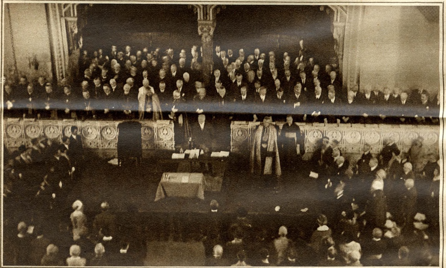
Megnyitőülés a Vigadóban: A himnusz.