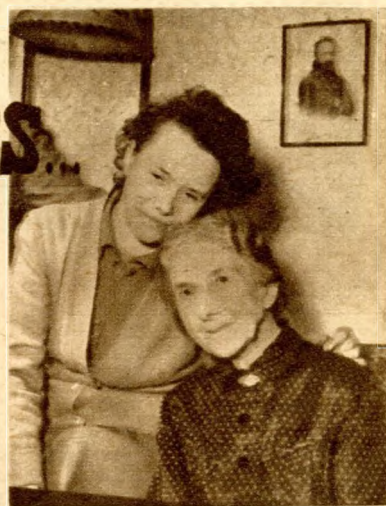
Ida néni és a lánya

miként történik, hanem sok embernek nem fér fejébe, hogy aki egykor Magyarország kormányzója volt, az szegény ember lehessen. — Alkalmasint saját hajlamaikról varrnak reám hímet, azt hiszik, hogy nem vándoroltam ki a számkivetésbe a nélkül, hogy a vándorbotom végére akasztott batyúba bele-tuszkoltam volna néhány milliót