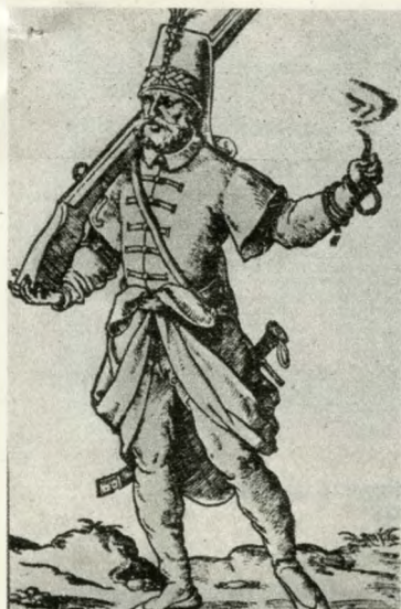
Janicsár égő kanóccal a kezében