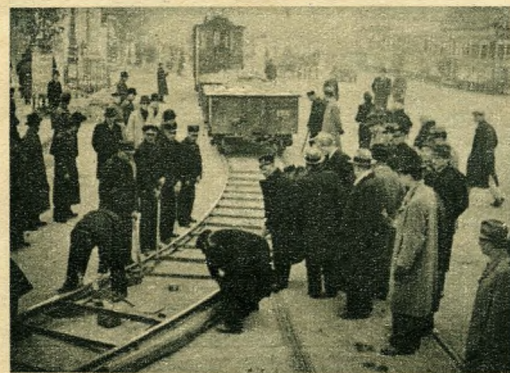
Romot takarít a papucsvágányok segítségével