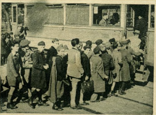
Különkocsijai diákkirándulót visznek