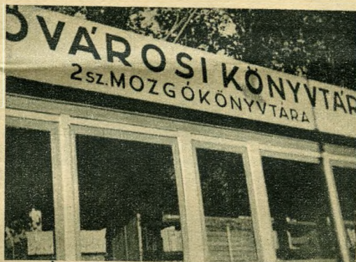
Mozgókönyvtárai kultúrárt terjesztenek