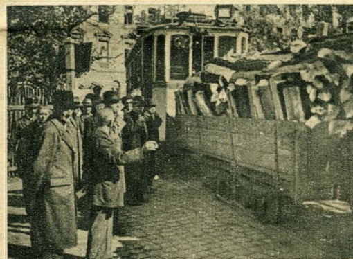
Fát hoz a budai hegyek erdőiből