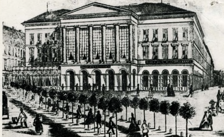
A Hild József építette Kereskedelmi Csarnok

kidolgozta az alapszabályt. A tőzsde első vezetőségébe a Pesti Kereskedelmi és Iparkamara, a Nagykereskedők Testülete és a Polgári Kereskedők Testülete választott négy-négy tagot. A Lloyd-társulat, a kamara, a testületek, a Kereskedelmi Bank — és ekkor már a tőzsde — vezetői között lényegében ugyanazokat a neveket találjuk: egy kis csoportot tartotta kezében a magyar, illetve a pesti kereskedelmi, ipari és banktőkét.