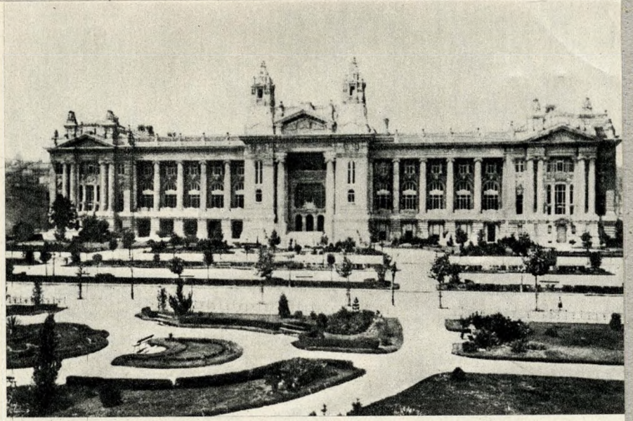
Az Áru- és Értéktőzsde

bályozása nyert legtöbb változtatást. A kiegyezés utáni nagyméretű — bár részleges — iparfejlődés, a hatalmas „gründolási láz”, mely a részvénytársaságok hosszú sorát hozta létre, a közlekedés és a hitelélet fellendülése következtében alakult vállalkozások, végül az önálló magyar kormányzat által kibocsátott államkötvények erősen megnövelték az értéktőzsde jelentőségét.