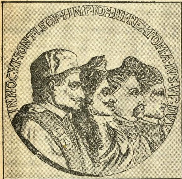
A szent liga emlékérmének előlapja

hatatlan dicsőség hárul. A csatamező birtokunkba maradt, az ellenség megszámlálhatatlan halottat, ágyúját és óriási kincseket hagyott rajta, melyek kezünkbe estek. A nagyvezér elfutott és legbecsesebb jószágainak én lettem az örököse. Már 10-ikén jelentettem, hogy megtámadom az ellenséget és 12-én a Bécs fölötti magaslaton állott a sereg, ahonnan beláthattam az egész török tábor és az ellenségek vereségét. A nagyvezér gögjében az hitte, hogy visszaverhet és egyúttal folytathatja az ostromot és valóban volt is még 150.000 embere. A janicsárok ott is maradtak az árokban, az ostromlottak kitörésének a visszaszorítására ő maga nekünk indult és a hegy aljában meg akart támadni, én pedig a balszárnyat küldtem ellene, melyet a bajor választó vezetett. A lotharingiai herceg szintén rendkívüli vitézséggel rohanta meg a törököt, leütte a Kahlenbergről és zavarba hozta. Midőn a nagyvezér maga támadta meg jobbszárnyunkat, nagy dühvel és hatalommal, huszárjaink erősen állottak ellen, úgy hogy időt nyertem soraim szétbontására, melyeket addig a hegy meredeksége akadályozott és félőrai harc után megfutamtottuk csapatjait. Amint a bajor választó és a többi fejedelem, aki hozzánk jött, látta, hogy megvertem az ellenséget, nagyon dicsérték vitéz-