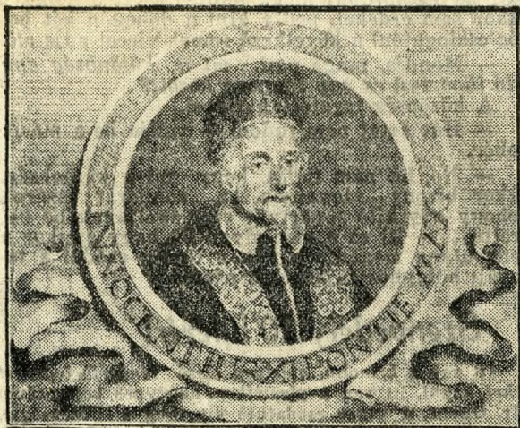
XI. Ince pápa

Mert Buda visszavétele csakugyan egyik legkimagaslóbb, legfontosabb eseménye volt az ezeréves magyar történelemnek. Legalább annyira sorsdöntően fontos, mint a Szabadságharc, Mohács, a Tatárjárás. Mert valóságos honfoglalás volt a 250 év előtti Budavár visszavételének a folytatása és következménye is. És hogy már a kortársak is mennyire érezték ennek az eseménynek rendkívüli súlyosságát, azt világosan bizo-