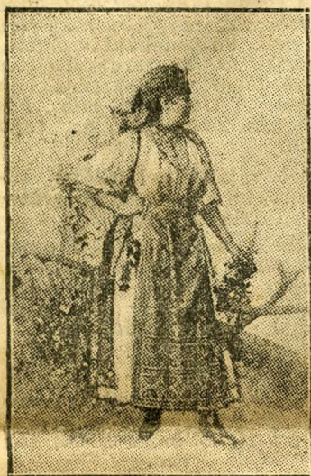
Digányasszony a »Cigányprince«-ben