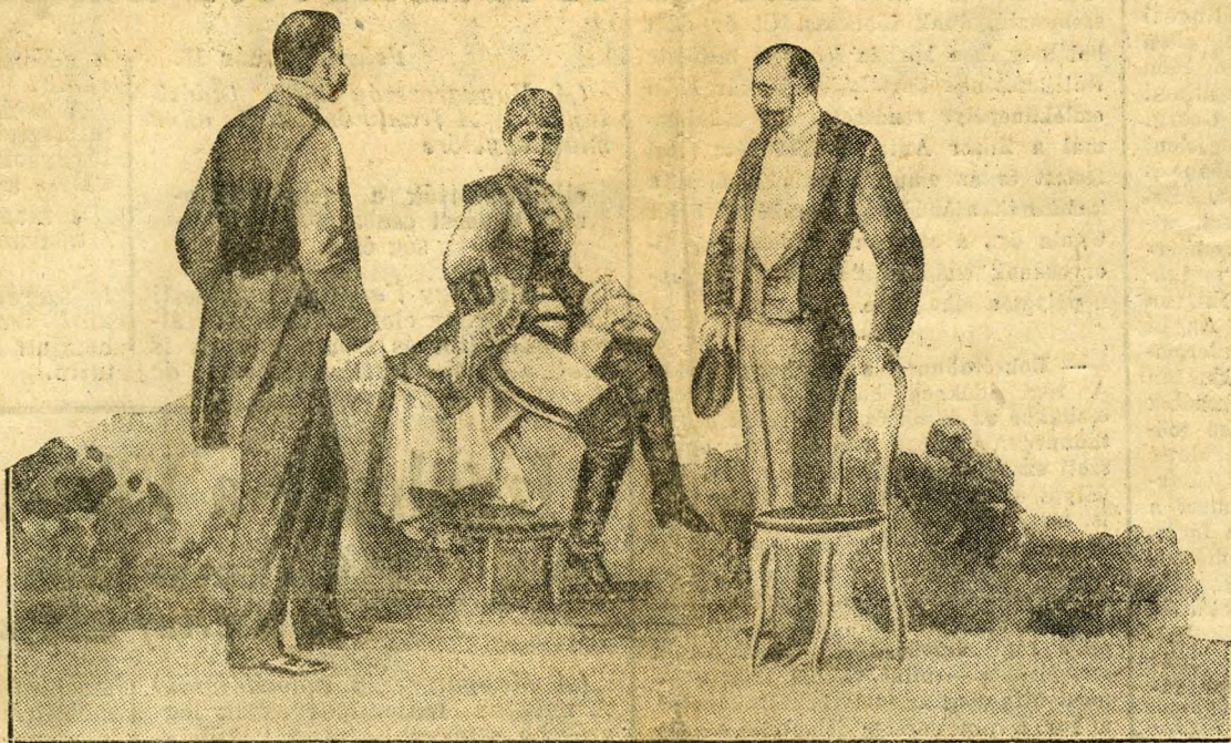
Edward walesi herceg 1889-ben a színpalack mögött keresi fel Blahánót