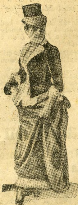
Blaháné a »Királyfogás«-ban