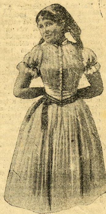
Menyecske az »Ingyenélők«-ben