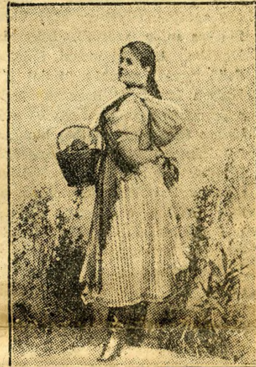
Parasztlány a »Száz év«-ben

Itt küldöm arcképemet, s boldognak érzem magam ha ezzel legkisebb örömet is szerezhetek kedves nagybátyámnak.