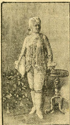
Blaháné Konti operettjében, az »Eleven ördög«-ben