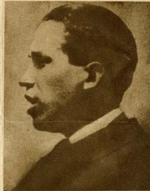
A IX. kerületben a LONYAY-utcát SZAMUELY TIBORROL nevezték el. Szamuely a Tanácsköztársaság hadügyi népbiztosa, az ellenforradalom elleni harc egyik vezetője volt. 1919 májusában ő vitte Leninhez a magyar nép üdvözetét.