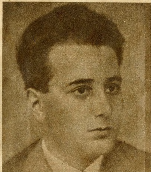
A XI. kerületben a TAKACS MENYHÉRT-utcát ANTAL JÁNOSRÓL, a Horthy-fasizmus elleni harc legjobbjainak egyikéről nevezték el. A Gondolat, a Társadalmi Szemle és a Korunk hasábjain küzdött a szabadságért. 1937-ben elfogták és több évi fegyházbüntetés után büntetés-századdal Ukrajnába vitték, ahonnan nem tért vissza.