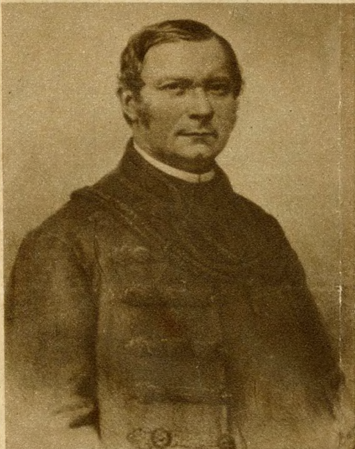
A II. kerületben a ZARDA-utcát RÓMER FLÓRISROL, a kiváló archeológusról nevezték el. Végigküzdötte a 48-as szabadságharcot és utána nyolc évig börtönbüntetést szenvedett. Mint az Akadémia tagja és nagyváradi kanonok munkásságát őröként a hazai történelem és régészet kutatásában töltötte.

A Budapesti Tanács Végrehajtó Bizottsága javaslatot fogadott el számos utca nevének megváltoztatására. Történelmünk nagyjai, festők, írók, természettudósok, orvosok, a magyar munkásmozgalom mártírjai kaptak utcát a fővárosban. A peremkerületekben is sok utca neve változott meg, mert ezek az utcanevek más kerületekben is megvoltak, vagy elavultak.