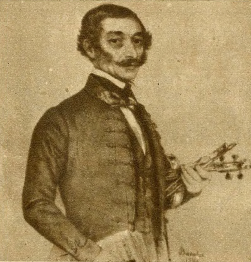
A XIV. kerületben a NOVIBAZAR-TER RÓZSAVÖLGYI-TÉR lett. Rózsavölgyi Márk, a múlt század első évtizedeinek nagy zeneszerzője, 1837-től a Nemzeti Színház karmestere volt. Népi gyűjtéseit és szerzeményeit 1850-ben fia adta ki.