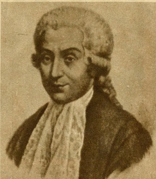
A XI. kerületben a HETVENEDIK-utca új neve GALVANI-UTCA. Luigi Galvani, a 18. század nagy természettudósa, a bolognai egyetem tanára volt. Anatómiai munkássága mellett hírnevét a róla elnevezett galvanizmus feltalálásának köszönheti.