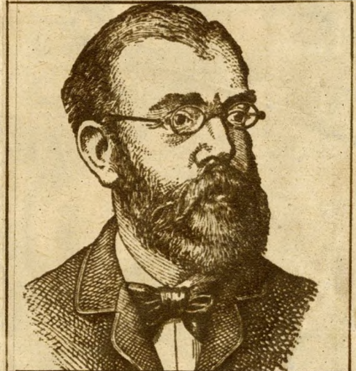
A XX. kerületben a TELEKI PAL-utca új neve KOCH ROBERT-UTCA. Róbert Koch német orvostudós a modern bakteriológia és a fertőző betegségek elleni tudományos védekezés megalapítója. A tuberkulózis bacillusát 1882-ben, az ázsiai koleraát 1884-ben fedezte fel.