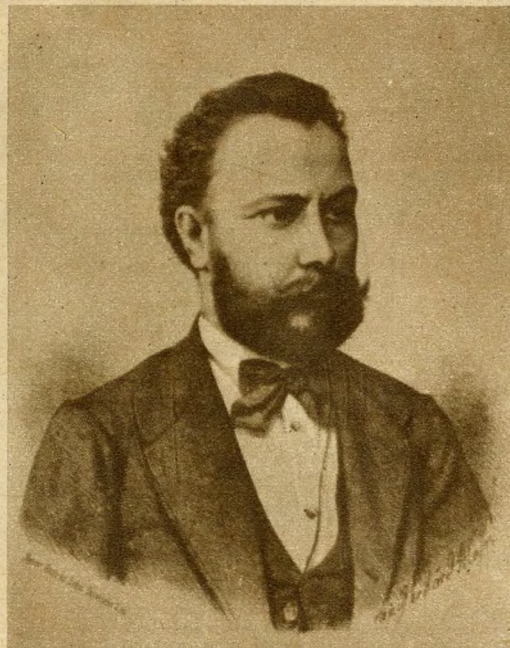
A VIII. kerületben a STAFFENBERGER-utcát APÁTHY ISTVÁNROL, a híres orvosról és természettudósról, a Tudományos Akadémia levelező tagjáról nevezték el. Főleg a mikroszkopikus vizsgálatok módszerei, az idegrendszer finomabb szerkezete és az összehasonlító szövettan terén végzett úttörő munkái.