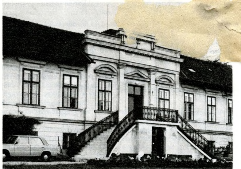
Régi villa a Ménesi úton, a Kertészeti Egyetem egyik épülete

Ez a kerület központja. Ide szalad be a Karinty Frigyes út, a Villányi út, a Bartók Béla út. Villamosok, autóbuszok végállomása. A forgalma óriási. Középiskolás koromban — hacsak a Körtér sarkán lévő Bartók mozi el nem térített — itt szálltam fel a 6-os villamosra. A megállóban a híres-hírhedt „Don-kanyar” bece-(gúny?) nevű kocsmá. Hogy honnan kapta nevét, nem tudom, talán onnan, hogy itt