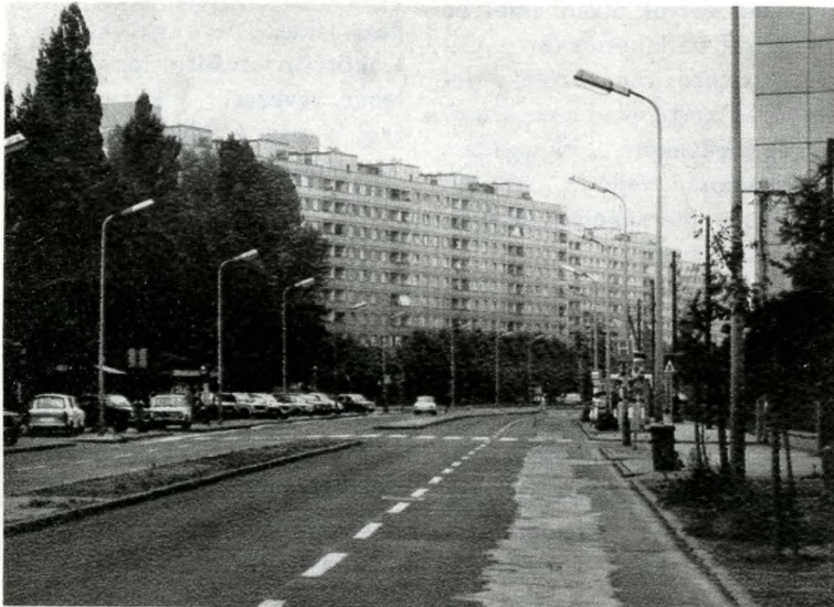
A Tétényi út