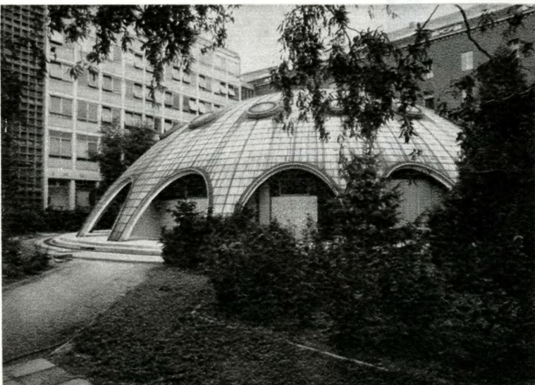
Atomreaktor a Műszaki Egyetemen