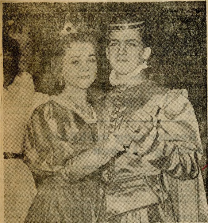
Jelmezes fiatalok a Munkaerőterialékok Intézetének vidám bálján a Gellért-szállóban