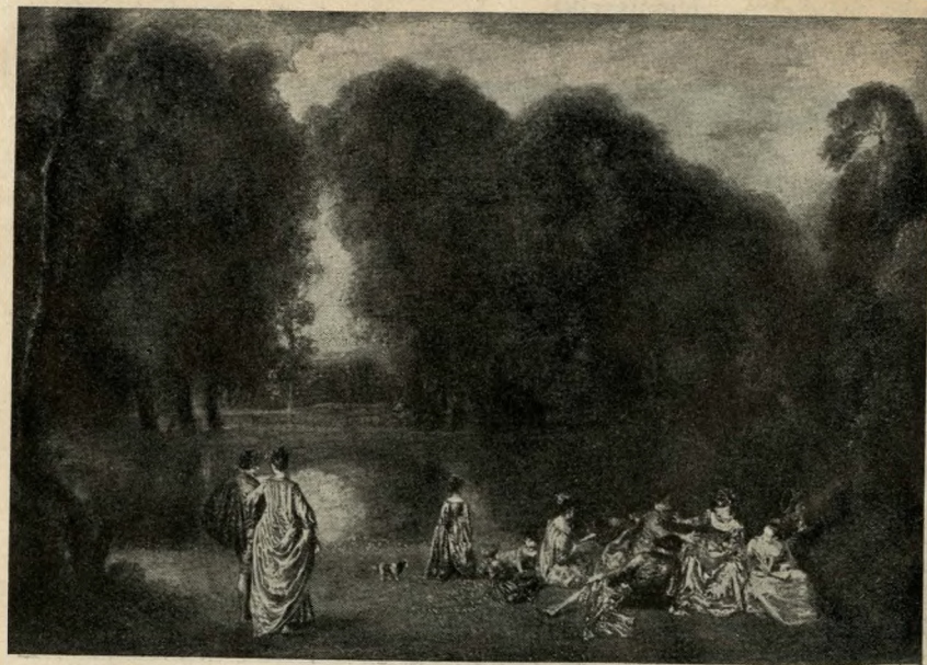
A. J. Watteau: Kerti ünnepség

Csakhogy nem minden sikerült úgy, amint azt Courbet elgondolta. Misem jellemzőbb rá, hogy mialatt a virtuozitás megbecsülését hirdeti és a materiáért, naturalizmusért lelkesedik, Rembrandtot másolja. Nem lehetetlen, hogy valami Nanát fest barátnőjével a Szajna partjára heve-