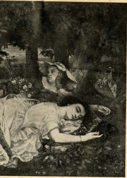
Lányok a Szajna partján