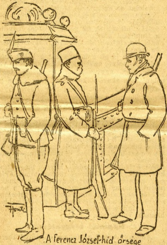
A Ferencz József-híd őrsége