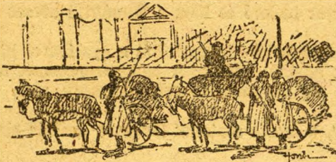
Római katonaság, a Calvin-téren.