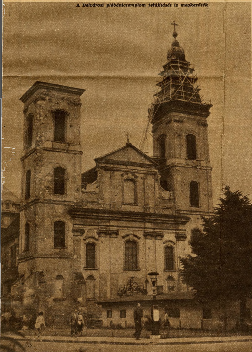
A Belvárosi plébániatemplom felújítását is megkezdték