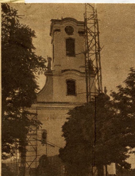
Építik a Flórián téri templom új kupoláját