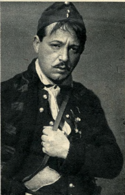
Bujdosó katona a Király Színház Mézeskalács előadásában

B eöthy László nem túrte, hogy a Király Színház mellett egy másik népszerű operettszínház is legyen a fővárosban. A Népopera sorsát így a sikerei pecsételték meg! Hiába tűnt fel néhány pompás színész a társulatban, hiába toborozták a legnépszerűbb zeneszerzőket, köztük Kálmán Imrét, Zerkovitz Bélát, a színház rövid idő alatt csődbe jutott. Alul maradt a versenyben.