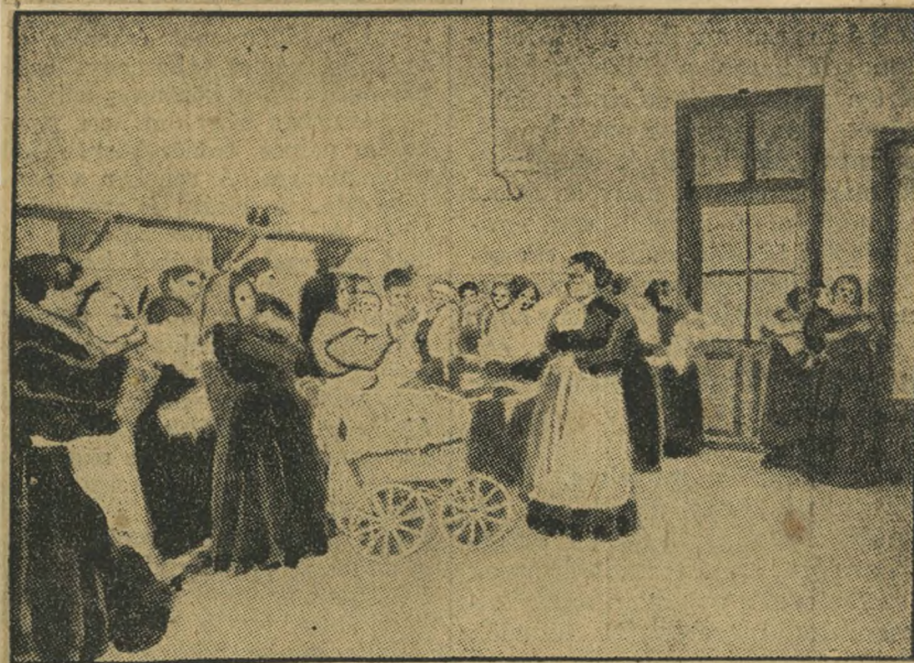
Tejkiosztás csecsemők számára. (Ó-budai fiók.)