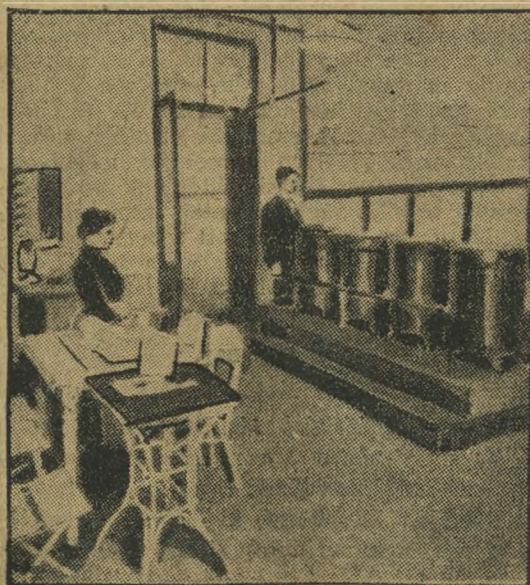
Tejkonyha. (Izabella-utca 42.)