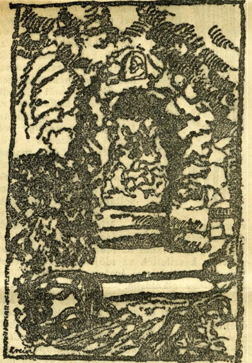
Jókai-plakett a kertben.

Mint valamikor a komáromi nagyaszonny, sokan úgy zárandokolnak ma is a svábhegyi Jókai-villához, ahol minden kavics, minden