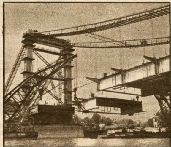
Ég és víz között a hídtag. Folyik a beemelés