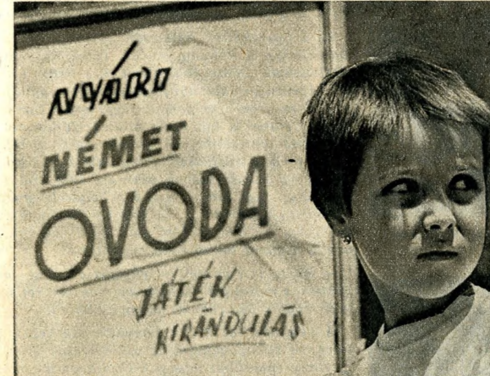
Ez is van: németet tanulnak a munkásgyerekek ... meg zenét