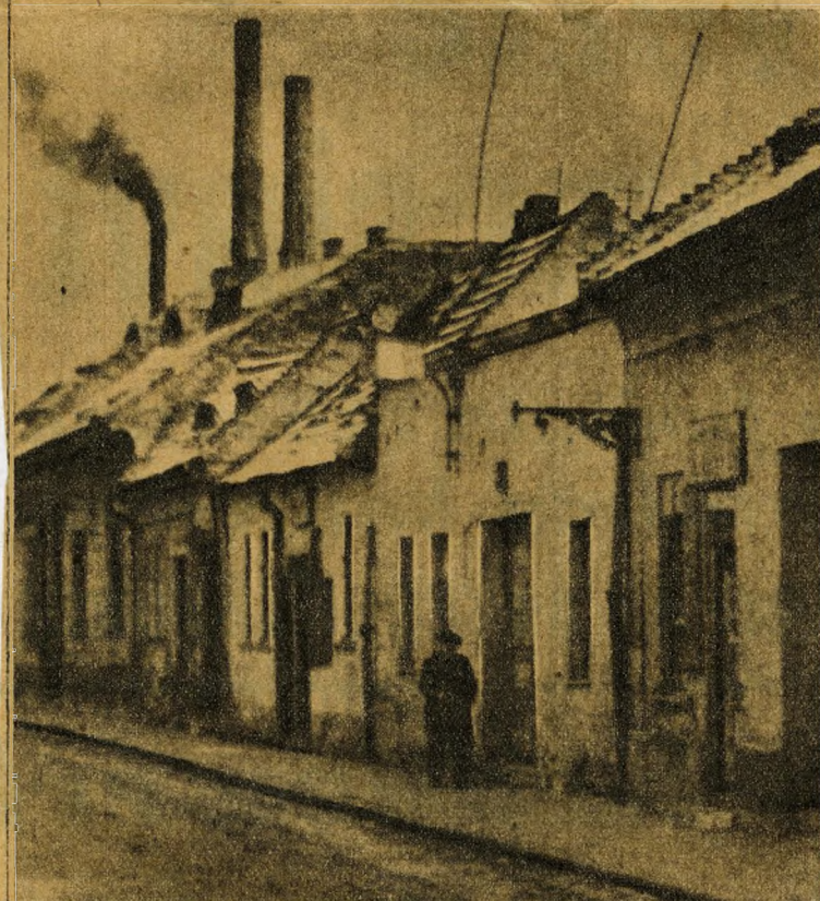
Gyárképmény füstölög a viskók mögött