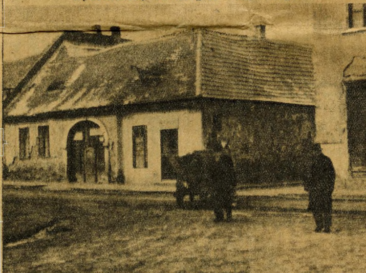
Ezekben a kunyhókban modern Óbudáról álmodnak