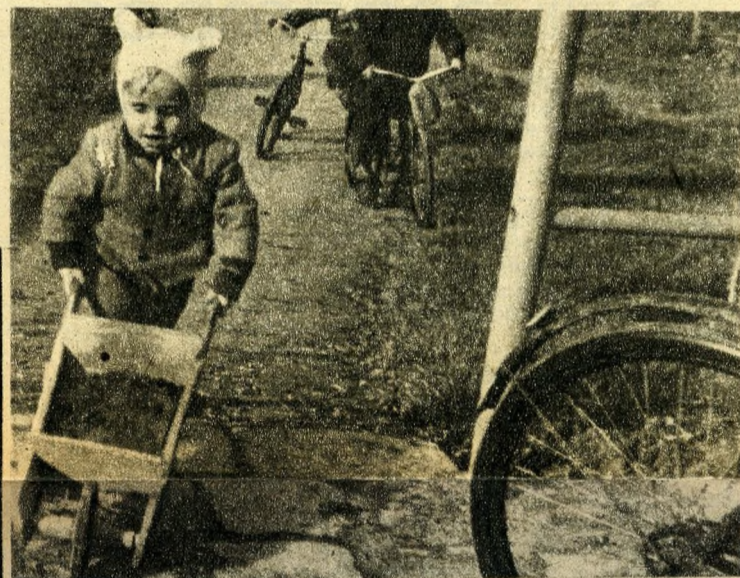
Pannika vidáman talicskázik