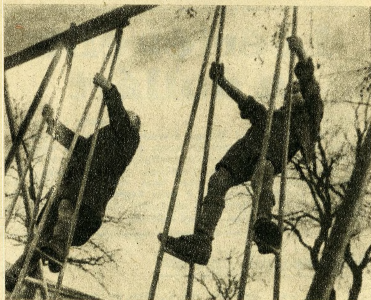
A marhavágóhid dolgozói játszóteret készítettek a környékbeli gyermekek számára. Vigan folyik a játék...

Más események is történtek a Soroksári-út és a Közvágóhid környékén. A marhavágóhid dolgozói játszóteret készítettek a környékbeli gyermekek számára. A HÉV-állomás is új színfoltot kapott. Hétfőn helyezték életbe az új áramvonalas motorkocsit és a kényelmes Pullman-kocsikat. Eltűnik a régi világ jellegzetes, rozoga külvárosi közlekedési eszköze, a düledező helyiérdekű kocsit. A ma dolgozói gyorsjárata, tiszta, kényelmes, modern, kirugózott, simán görbülő vagonokban utaznak munkahelyükre. Nemcsak otthon, nemcsak az üzemben változott meg a külváros dolgozóinak élete, hanem útközben, a lakástól az üzemig vagy az üzemtől a lakásig is érzi a demokrácia áldását, az emelkedő életszínvonalat.