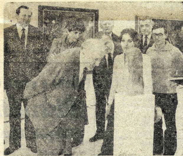
Fiatalköznevelők alkotásai előtt a Budapest Kiállító-teremben.

Maróthy László, a politikai beszélgetésen először arról szölt, hogy a mai nap is azt bizonyítja: az