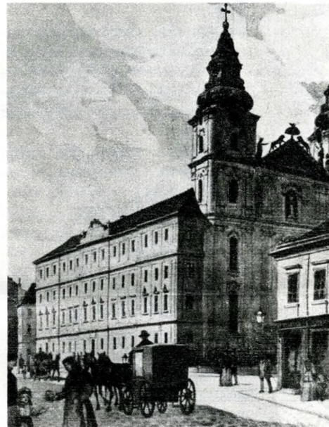
Az egyetem központi épülete 1805-ben (Nagyszeminárium)

ban feloszlott jezsuita rend akadémiaját kapta. Ez az 1873-ban lebontott épület a Mátyás-templom északi oldalához csatlakozott. Az elemi iskola és gimnázium alsó tagozata is ide került. Az utóbbiak számára 1779-ben az egyetem az esztergomi káptalantól megvette a ma múzeumként szolgáló Fortuna utca 4. számú épületet, az úgynevezett „dézsmaházat”.