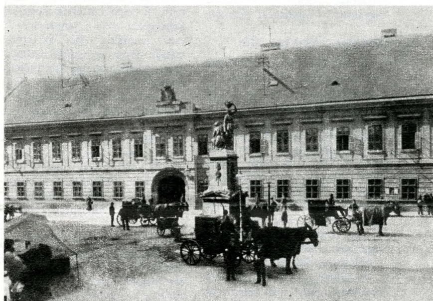
A Királyi Kúria a mai Curia utca 2. számú ház helyén; ide költözött az egyetem bölcsészeti és jogi kara 1784-ben

pelte meg a nemzet, amelyet egykorú leírások szerint Mátyás király és Beatrix menyegzője óta nem látott Buda népe.