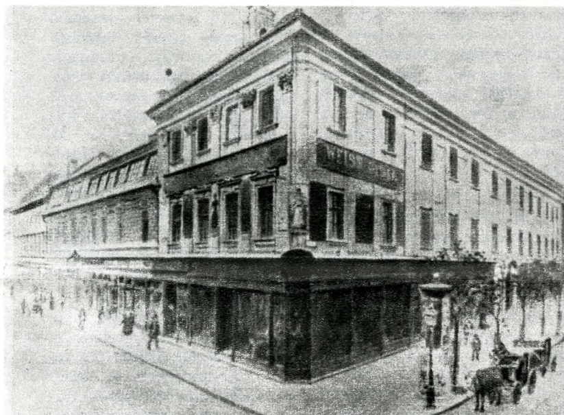
Az orvosi kar egykori épülete a Hatvani (Kossuth Lajos) utca és az Újvilág (Semmelweis) utca sarkán