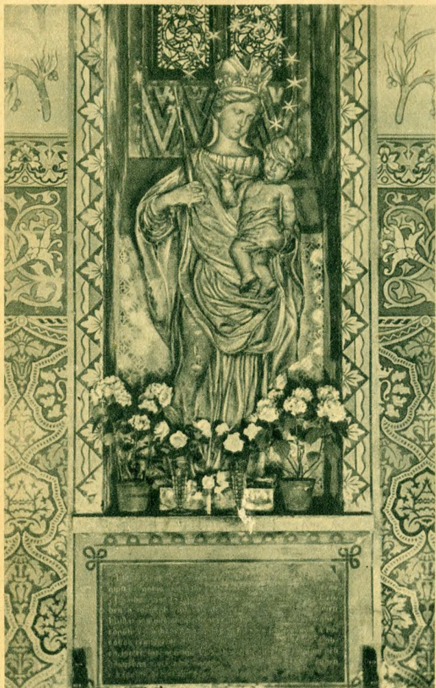
A koronázó Mátyásfemplomban levő Csodátévő Mária szobor.

bástyák is, de a török mégsem hátrált. Éjjel-nappal folyt a harc. Ahogy egy nap ostromával sikerült rést űtni a falakon, éjjel a török hadak már rendbehozták a faltörök pusztításait.