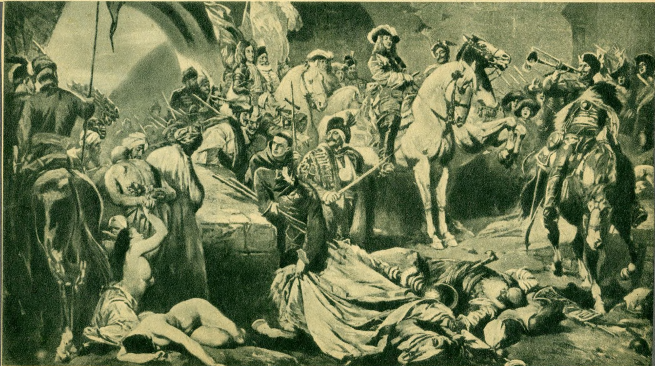
Savoyai Jenő az ostromló sereg élén bevonul Budavarába.