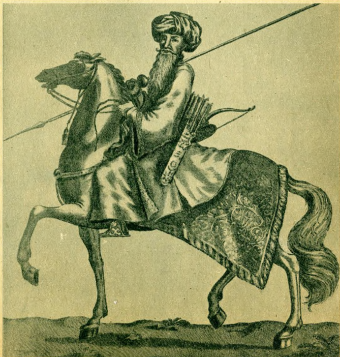
Abdi, az utolsó budai pasa.