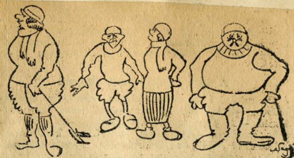
Alakok a ródli-pályáról

Egész nap, délelőtt, délután jönnek és jönnek az emberek fel a Svábhegyre. A fogaskerekű mindig tömött, zsúfolva közlekedik. Tele van jókedvű,