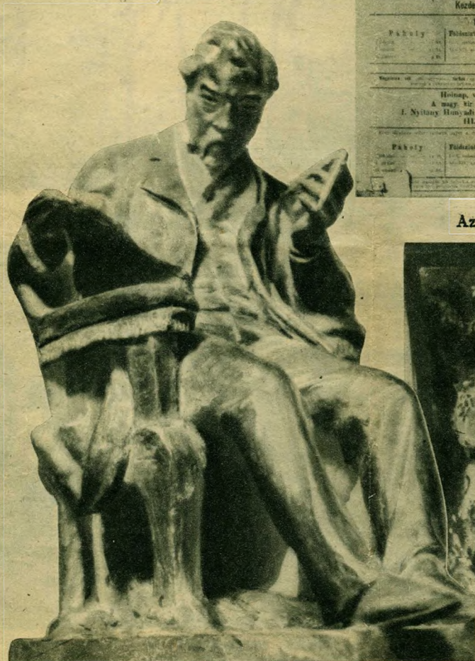
Ybl Miklós szobra

Jubilál a budapesti Operaház. Ötven éve áll Ybl Miklós gyönyörű alkotása a zene szolgálatában. A múlt század hetvenes éveiben határozták el, hogy az operaelőadásokat függetleníteni kell a Nemzeti Színháztól. Pályázatot írtak ki 1875 szeptemberében és még ugyanabban az évben, október 11-én ünnepélyes keretek közt Podmaniczky Frigyes báró intendáns, Ybl Miklós építész és Hofhauser építési vállalkozó tették meg az első kapavágásokat. Egy hónappal kevesebb, mint kilenc évig épült. Ybl építész nagy előre látással eredetileg 2000 személy befogadására tervezte, (nem szabad elfelejteni, hogy az építés megkezdésekor a főváros lakossága csak 500.000 körül volt), de Ferenc József király kifejezett kívánságára, csak 1100 személyes lett. Erkel Sándor volt első igazgatója, főzeneigazgatója Erkel Ferenc. Az első színpadi próbát 1884 szeptember 24-én tartották. A zenekar a Nemzeti Színház zenekarának 46 tagjából állt, amely szám az Operában hatvanra emelkedett. A király és a legelőkelőbb közönség jelenlétében 1884 szeptember 27-én nyitlak meg az Operaház kapui. A megnyitás óta csak egyszer, 1912-ben volt nagyobb szabású átépítés, amikor az 1100 férőhelyből 1200 lett, de azóta is a nézőtéri helyek különféle beosztása által 1300-ra emelkedett.