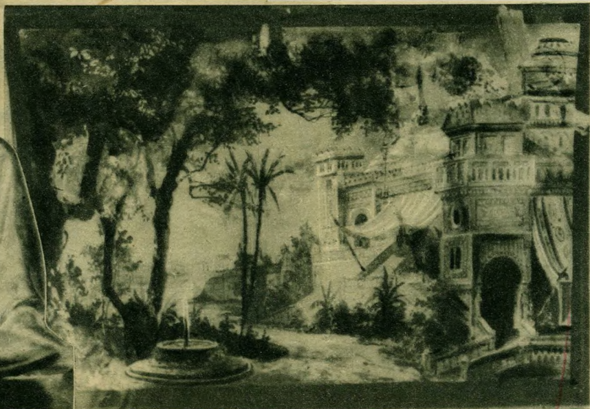
Az első „Sába királynő”-díszlet