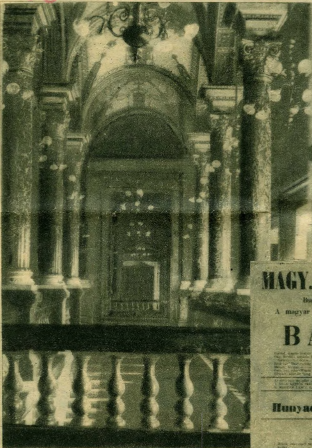
A királyi feljáró