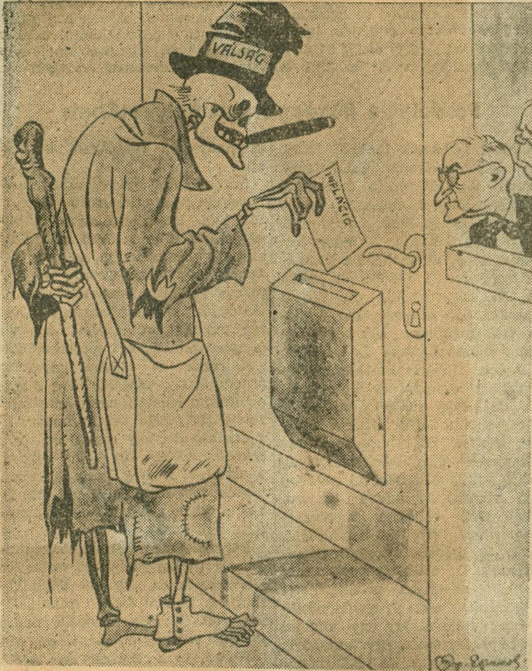
„Az első figyelmeztetés.” Trumanék bármilyen nagy hangon készülnek háborús tervükkel, megdöbben képpel néznek az inflációra, a válság jeleire.

A Fővárosi Könyvtárban most bemutatott „Szovjet karikatúra mesterei” című kiállítás anyagából közöljük az alábbi rajzokat, amelyek szemléltető módon mutatják be, hogy az imperialisták semmiben nem különböznek a fasisztáktól.