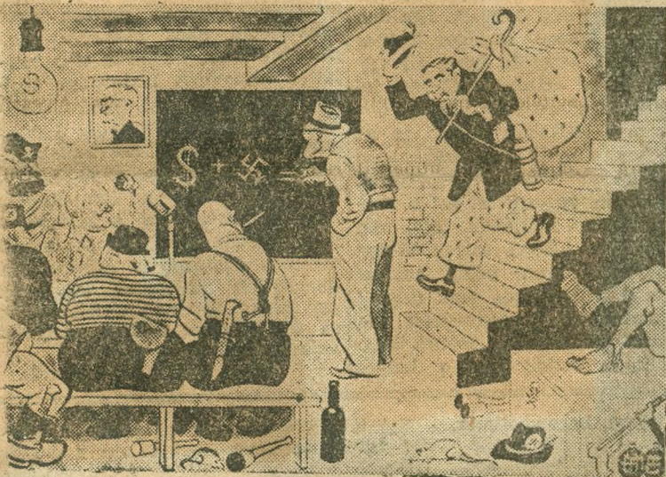
A washingtoni bűnbarlangban gyülekeznek a dollár hatalmaságai. Kifelé ugyan titkolják, de maguk között természetesnek tartják, hogy a dollár és a horogkereszt egyenlő a fasiszmussal.