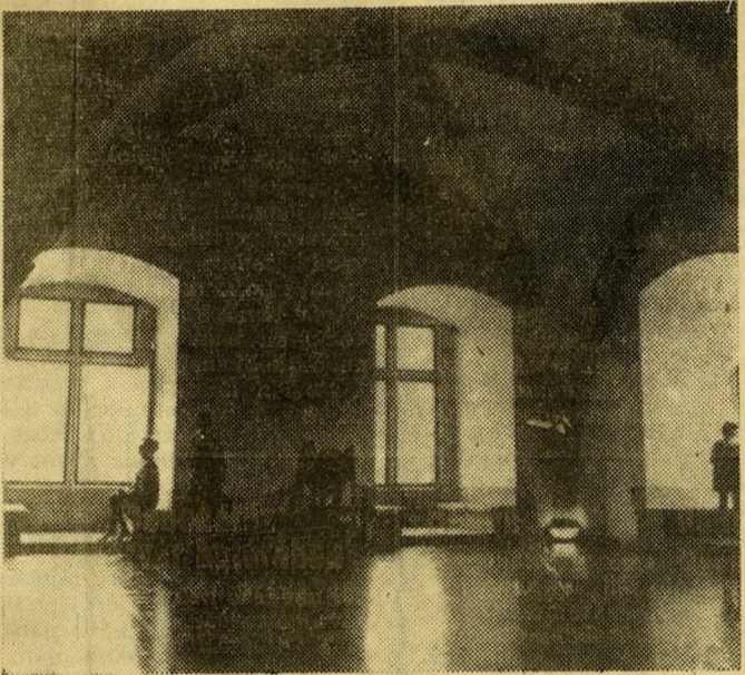
A régi Buda kiállításának egyik legszebb része a gótikus nagyterem, Zsigmond király 1420-as falait nemrégiben restaurálták.