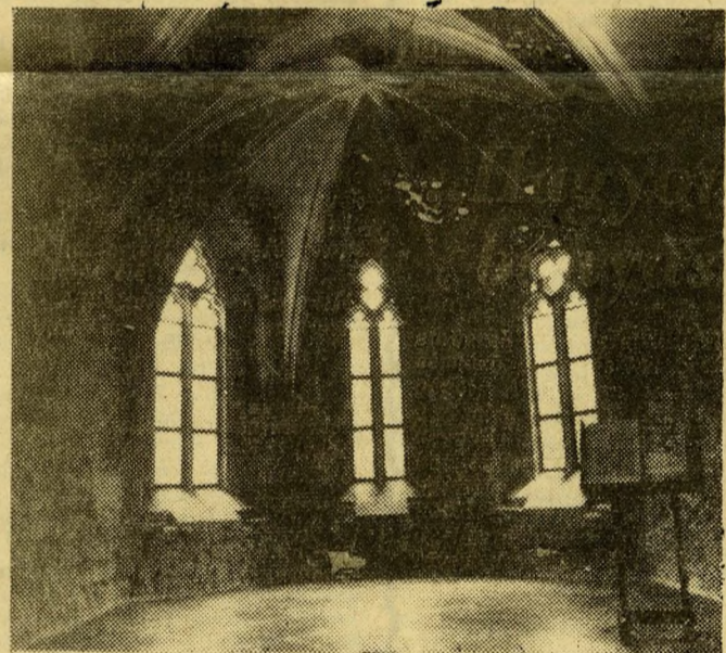
Ez a szép kápolnarész talán a legrégebbi a látnivalók közül: 1365-ben emeltette Nagy Lajos király.