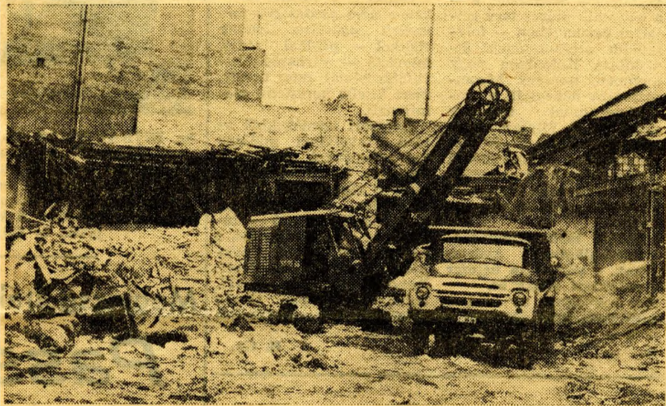
Bontanak a Práter utca elején.

Mester utca—Pozsonyi út + Az első szakasz