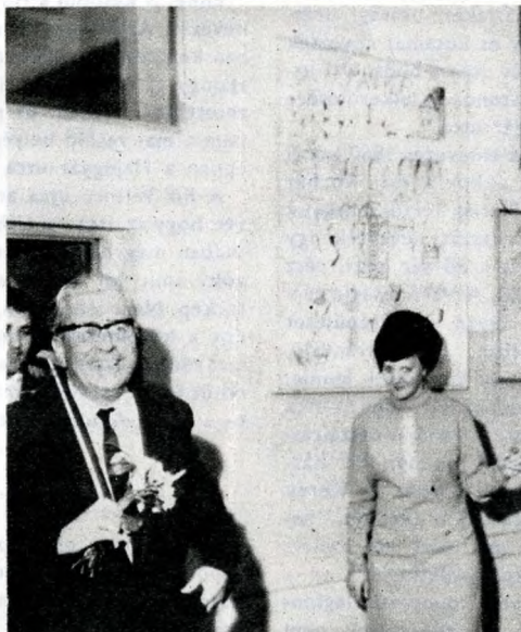
A csepeli dolgozók esti iskolájának ballagásán