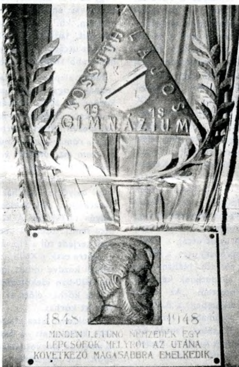
Kossuth-emléktábla a pesterzsébeti gimnáziumban

De mindaz, amit a XXI. kerületi Jedlik Ányos Gimnázium igazgatójaként és a felnőtt-oktatás tanáraként a csepeli gyáróriásban átéltem, tanultam és meggyőződéssel továbbadtam – mindaz már egy másik élménybeszámolóba tartoznék.