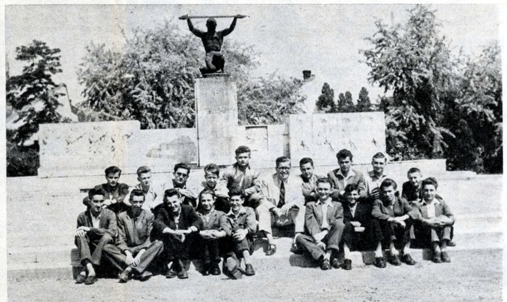
A pesterzsébeti Kossuth Lajos gimnázium 1957-ben végzett tanulóival