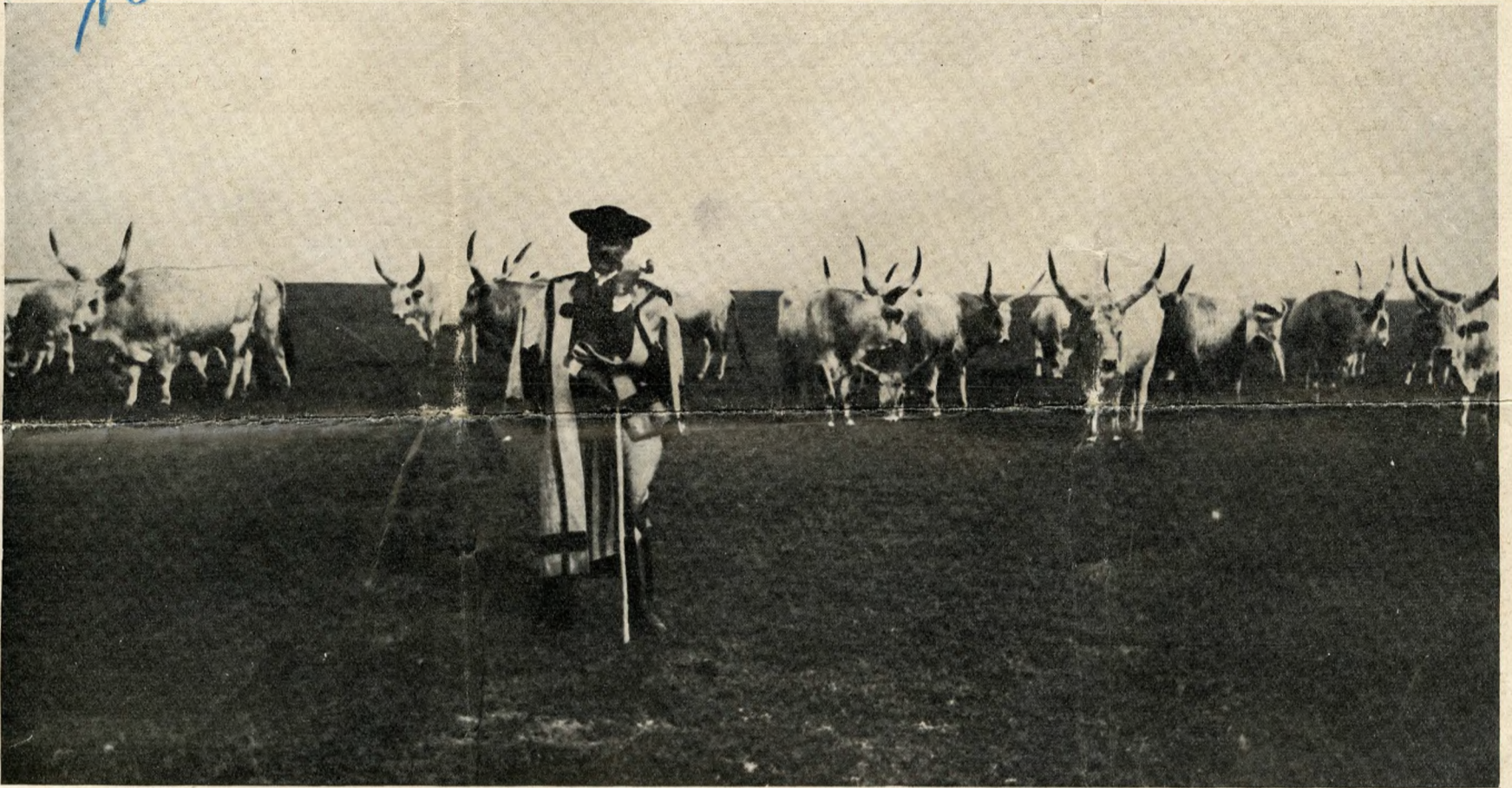
Dans la pouzta hongroise : un meneur de bœufs.

A peine avez-vous franchi la frontière, à peine êtes-vous revenu de votre surprise de voir les chefs de gare se figer respectueusement au garde-à-vous au passage des trains, et déjà le chœur des doléances vous assaille.