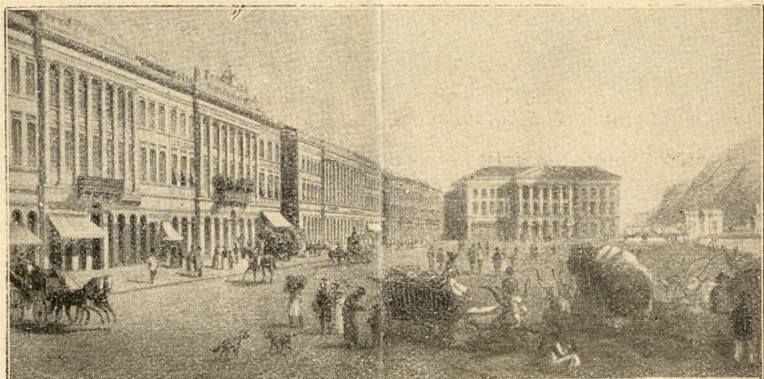
A mai Ferencz József-tér a koronázás évében. (Egykori rajz.)

Végezzük pedig e cikkünket az 1870 január elsején megejtett népszámlálás adataival, amely szerint Pestnek 200.824, Budának 54.577, összesen tehát 255.401 lakosa volt. Az 1842. évben 61.139 lelket számláltak össze Pesten, 30.139-et Budán, a két város lakossága tehát kétszeresénél is többre emelkedett s egyre nőtt a világvárosi méretekig. S ha nem jó közbe a világháború és Trianon . . .