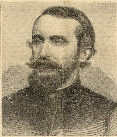
Tisza Kálmán 1867-ben

Örvendünk, hogy a költemény kétségbeeső hangja többé a nemzeti érzelmek kifejezése nem lehet.