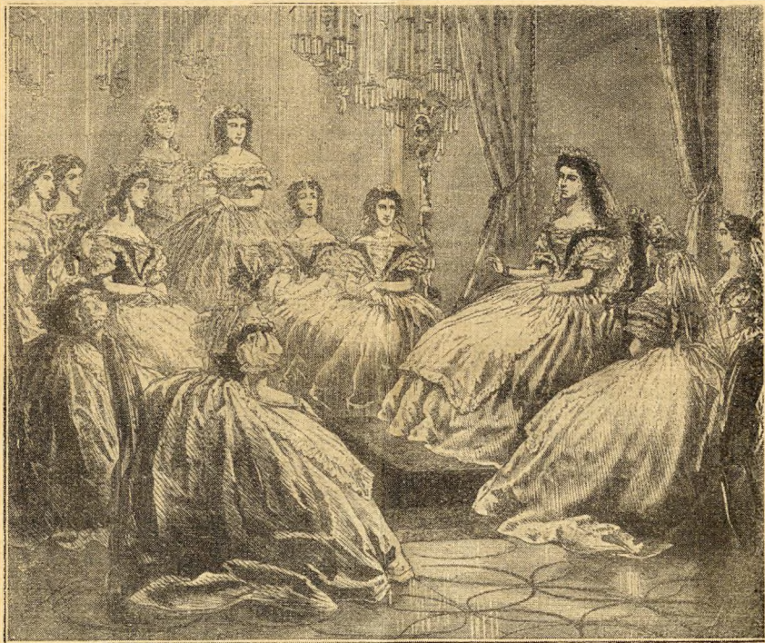
Erzsébet királyné magyar hölgyek körében Budán.

Megtelnek az éttermek s a Fővárosi Lapok megjegyzi 1871-ben, hogy a Hungária főpincérének jövedelme a