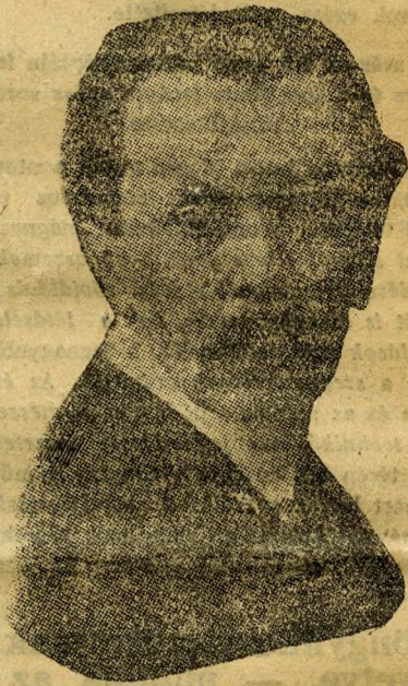
Bánffy Miklós gróf.

Bánffy Miklós az Iparművészeti Iskola helyiségeiben készítette el az emlékmű agyag-