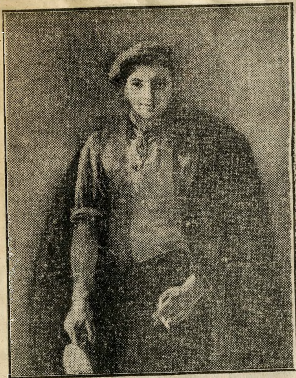
SZTAHANOVISTA KÖMÖVES ARCKEPE