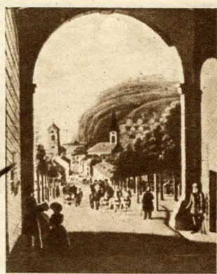
Kilátás 1836-ban a tabányi kapun át a Gelérthegeyre

— Ez Budapestnek — lélekszámban — a legjelentéktelenebb kerülete, ugyanakkor múltjában is, meg a jelenében is, történelmében is, mai valóságában a leggazdagabb.