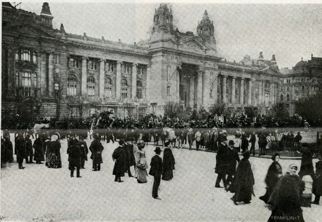
A TŐZSDE ELŐTT A TEMETÉSKOR.

A hatóság ugyanis eddig se nézte jó szemmel, hogy a magyar urak ide jártak horgászni s a legsúlyosabb halacszkákat kihúzták, de mert semmi regulaellenes nem volt benne és befolyásos nagy urak jónak és hasznosnak itélték a szászoknak a magyar fajba való elvegyülését (ez volt a formula), egyenes úton semmit se lehetett ellene tenni. Hát fogták magukat és nem egyenes úton akadályozták meg, csinálván Lőcséből egy gyászoló fekete várost, a hol nincs zene, nincs mulatság, nincs élet, a hova eszébe se jut virágot tépni jönni va-