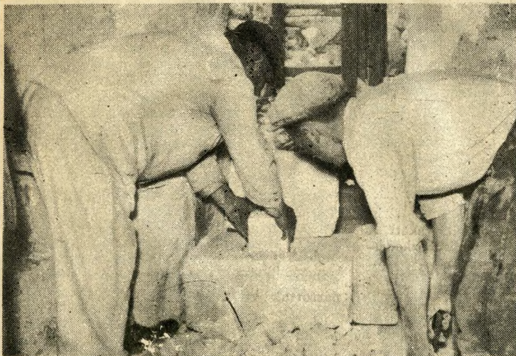
Az átépítés során megtalálják a templom alapkövét

A szentély lebontása és újra felépítése helyett az indokot erre az elhatározásra az adta, hogy a szentély boltozatán lévő, a jelen század elejéről származó, csekély műértékű festés egy részének eltávolítása után teljes épületben előkerült egy a XVIII. század végéről származó értékes freskó, amelyet Falconer József Ferenc festett. A freskó megmentése érdekében határozta el az egyházközség a szentély elhúzását. Erről a munkálatról Bres-