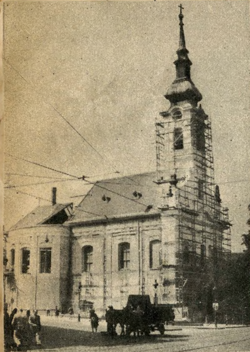
Az átépítés alatt álló Krisztina-téri templom, ahol gróf Széchenyi István az esküvőjét tartotta