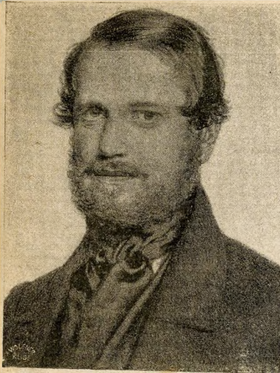
Clark Vilmos, a Lánchíd tervezője