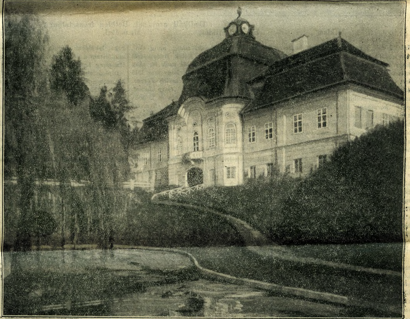
A gernyeszegi kastély. Itt született gróf Bethlen István 1874 október 8-án

ben-ben, egy kis kocsmában, amelyet bécsi kispolgárok látogatnak, fogyasztotta el szerény ebédjét, vagy vacsoráját, ez volt az egész idő, amit a saját pihenésére szánt. A nap többi részén, kifogyhatatlan energiával dolgozott. Munkája három-