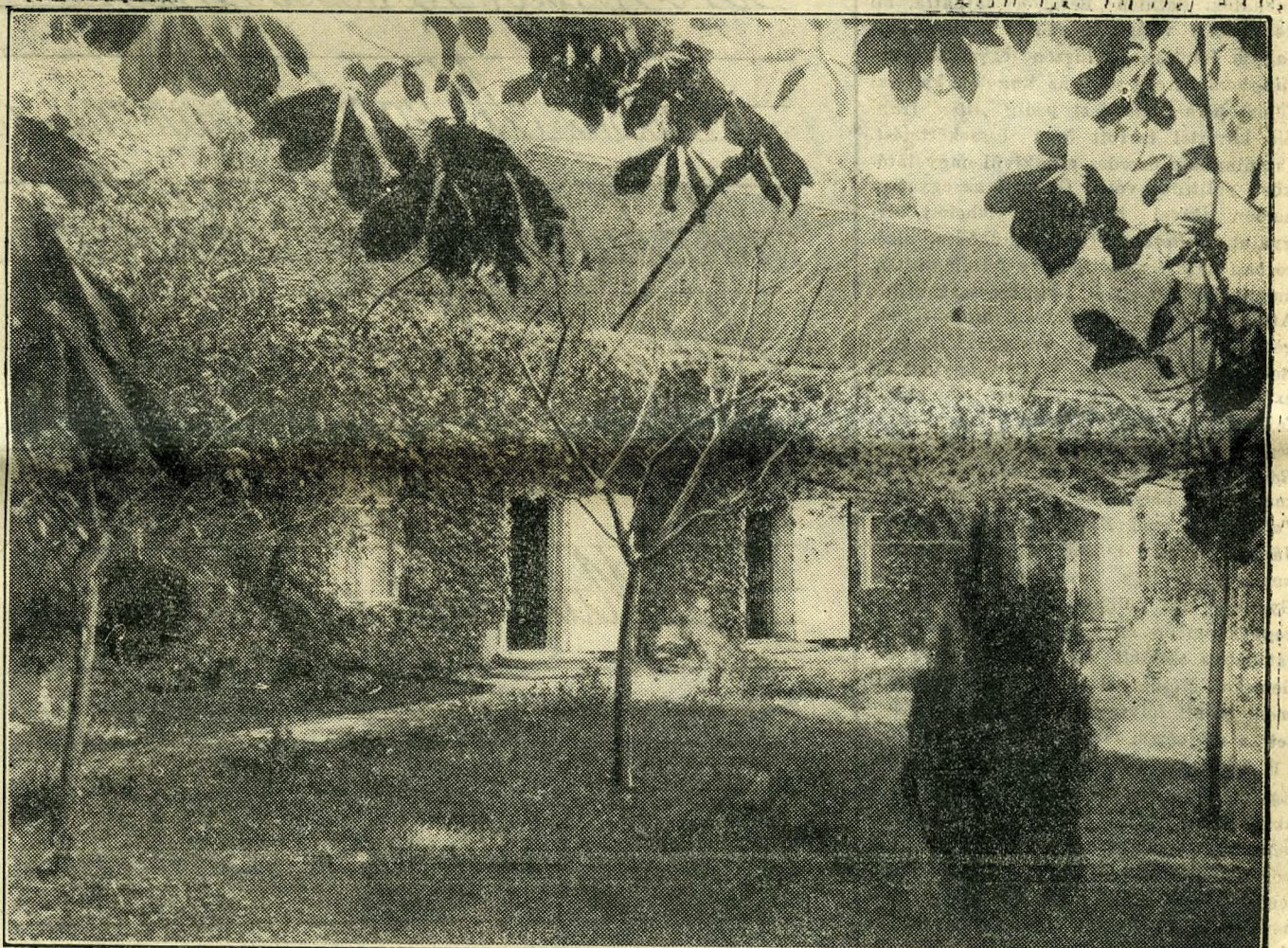
Gróf Bethlen István inkei lakóháza