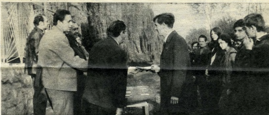
A kerületi döntő díjkiosztása