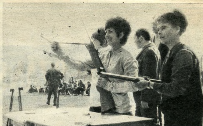
Egy kép a nagy verseny egy jellegzetes mozzanatáról