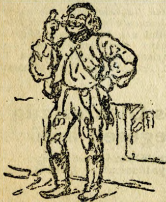
UJHÁZI EDE GONOSZ PISTA SZEREPÉBEN

A 1400 koronáért megszerzett Ujházi ereklyék között a következő tárgyak szerepeltek: Egy Ujházi plakett bronzból; a magyar művészek ezüst serlege, amelyet festők és szobrászok ajándékoztak a Mesternek, „Ujházi Edének, a legnagyobb Gonosz Pistának“ felírással; egy ezüst plakett a Nemzeti Színház művészeinek aláírásával, a Dunántúli Közművelődési Tanács feliratos plakettje; két kis ezüst koszorú; festmény „Ismeretlenről“, a