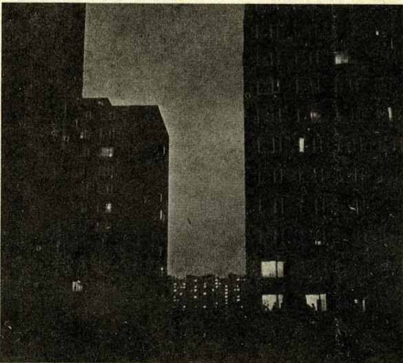
A kockaház földszintjén két ablakban is „ég a világ” — nyitva a klub

az egyik üres telken felállítottak két futballkaput és az utcák, terek bajnokságának izgalmas rangadói még a felnőtteket is kimozdították „közönyükből”. A vasárnap délutáni szieszta helyett jó néhányan ott szorongtak a szurkolók között.