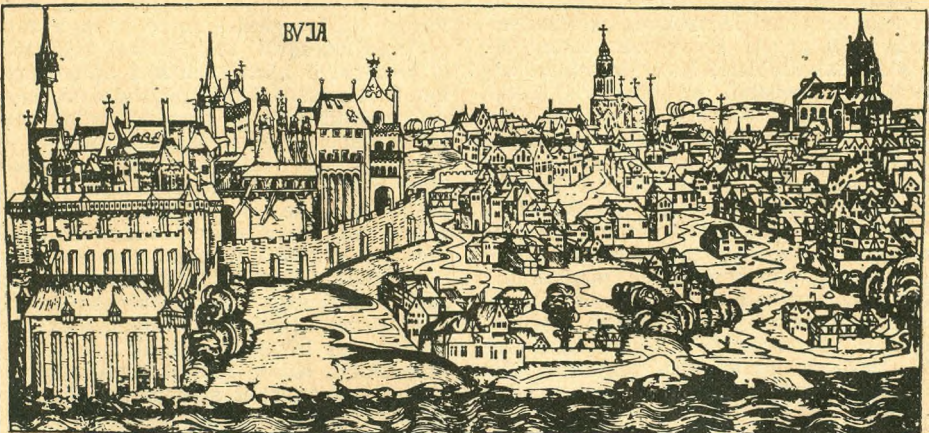
Budavár látképe a Schedel-féle világrónikából (1493)

A második kötet anyaga a főváros egyesítésétől, 1873-tól 1919-ig, a Tanácsköztársaság leveréséig terjed. A három város egyesítésében öltött testet Budapest számára a kiegyezés, ez indította el a modern kapitalista fejlődést, az egységes várospolitika kialakítását, az európai méretű városrendezést, a gazdasági élet és a közlekedés fejlődésével párhuzamosan haladó közoktatási és kommunális hálózat kiépülését. Ebben az időszakban indult el fővárosunk a XIX. századi modern nagyvárosi fejlődés útján. A dokumentumok bemutatják azonban a tőkés fejlődés árnyoldalát is: a lakásnyomort, a munkásság mind elviselhetlenebb élet- és munkakörülményeit, politikai elnyomását, a liberális városvezetés csődjét, mindazt a kapitalizmus szülte szenvedést, amit az első világháború tetőzött be. A főváros fejlődésének folya-