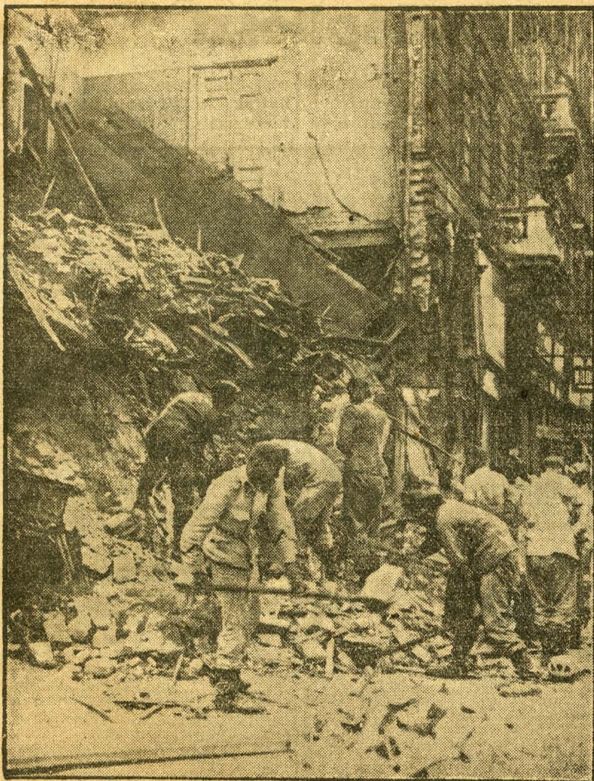
Utászok takarítják el a romokat