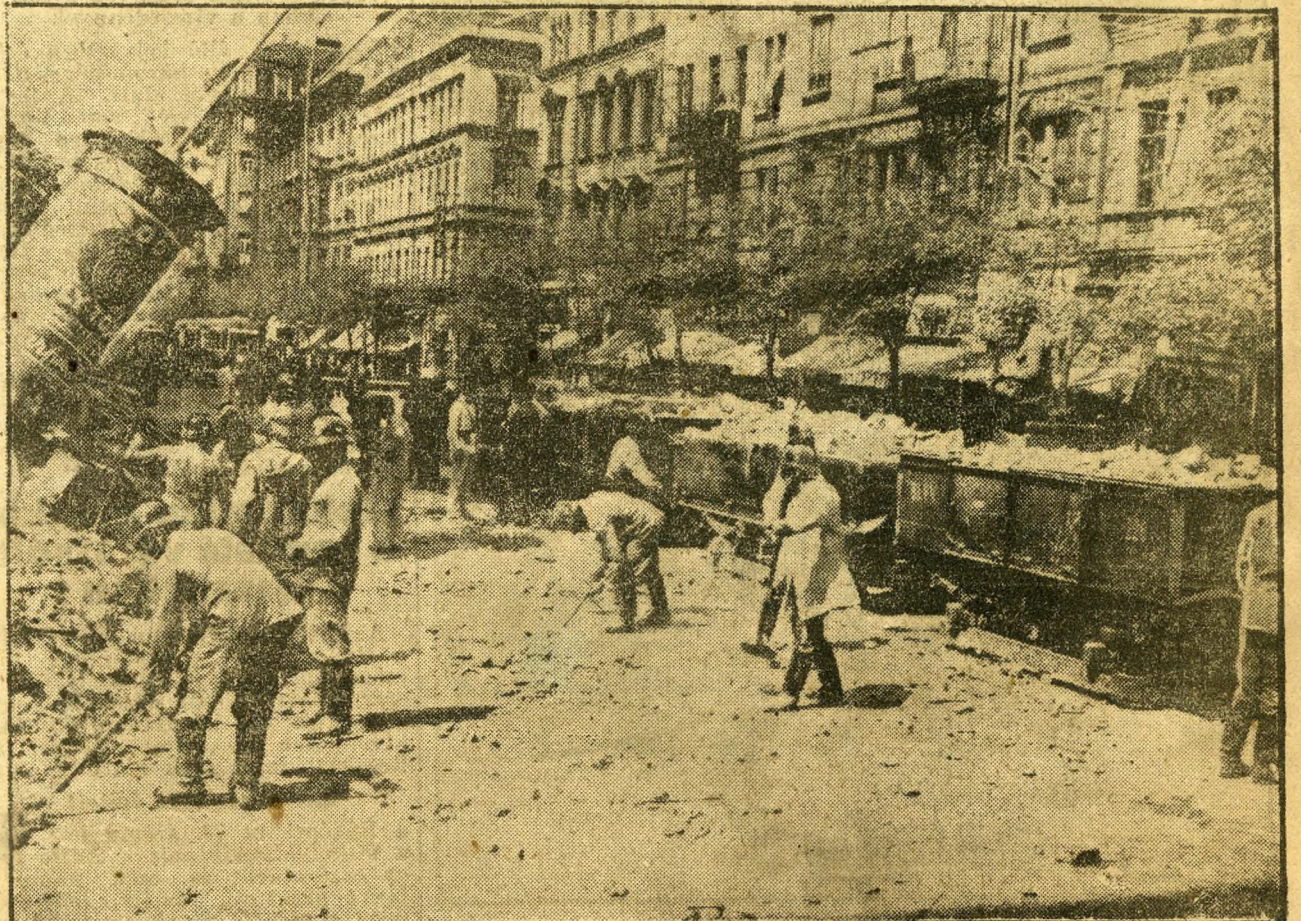
Az összeomlott épület alól 40 vagon törmelékot szállítanak el.

rosi ellenőrzés nélkül lefaraghatták, meggyengíthették. A többszöri átépítések, ráépítések