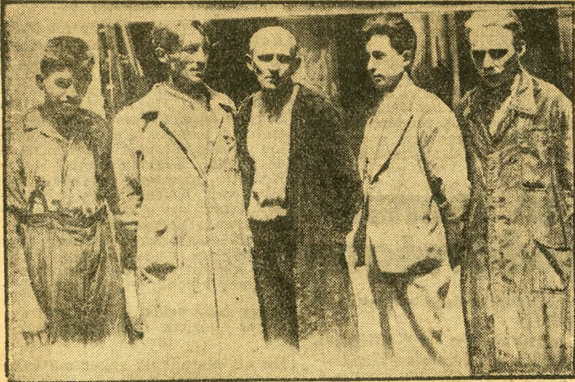
‘Akik a halál torkából az utolsó pillanatban menekültek meg.

gig érnek fel és most ezek támasztják meg a falakat.