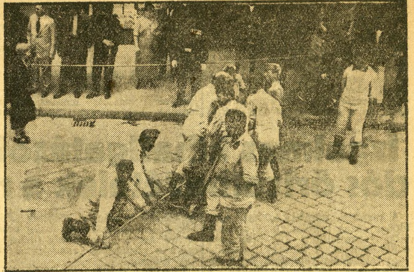
Géppel húzzák ki a mázsás súlyu vasgerendákat a törmelék alól.