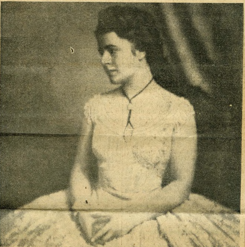
L'artiste qui interprète le rôle de l'impératrice dans « Sissy ».

(De notre envoyé spécial Georges OUDARD)