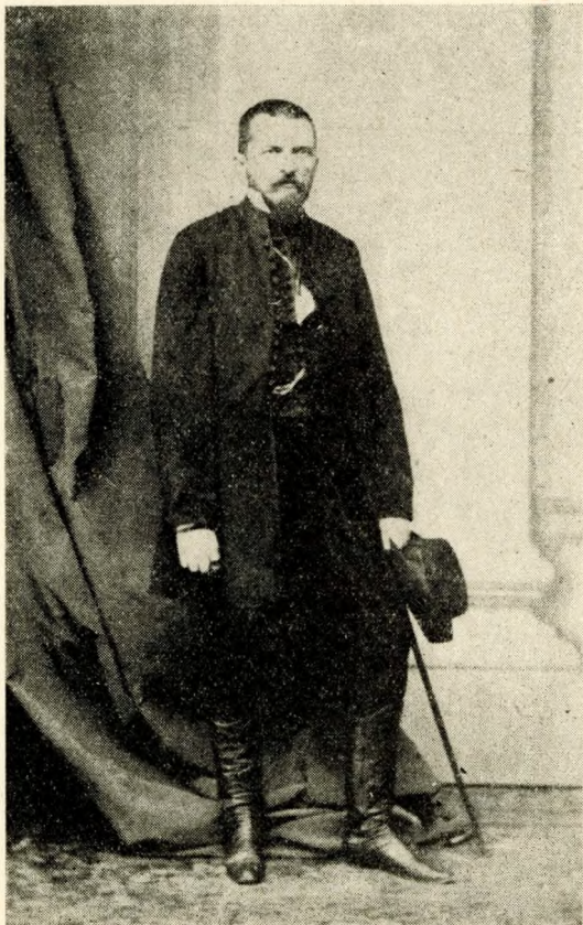
1. ábra. Zsigmondy Vilmos arcképe a városligeti fúrás idején

Zsigmondy a Magyarhoni Földtani Társaság 1866. december 12-i szakülésén hozta először nyilvánosságra a városligetben tervezett fúrását és bizonyította, hogy az ott fakasztandó forrás hőfoka a budai hőforrások ismert legnagyobb hőmérsékletével lesz egyező. A fővároshoz intézett beadványával foglalkozó bizottság a pesti oldal vízellátása érdekében szükségesnek tartotta egy artézi kút telepítését. A főváros közgyűlése elfogadta a javaslatot és 1868. március 3-án aláírták Zsigmondy val a szerződést.