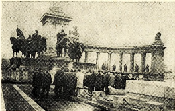
3. ábra. A városligeti artézi kút emléktáblájának avatása a budapesti Hősök terén