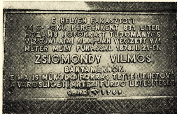
4. ábra. Az emléktábla

vezeték építés. Sikerei tetőpontján sem feledkezett meg elaggott szaktársai, a bányászok nyugdíjának rendezéséről , nehogy — mint mondotta — „a szegény bányásznak öreg korára a koldusbot legyen a sorsa”. Évekig tartó szívós harc után végül itt is sikert aratott.