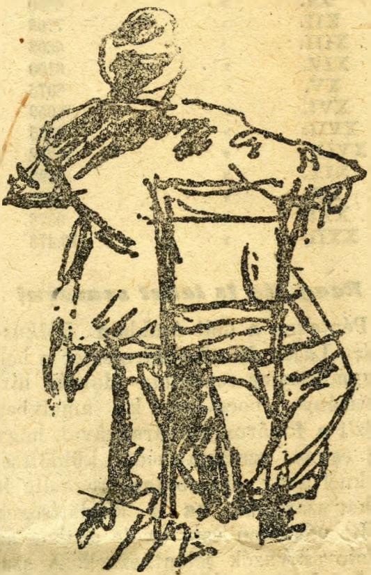
Egy törzsvendég, akit még a választás sem érdekel

A választás első napján, tehát Áldozósütőtörtök reggelén bizonyára megfigyelték a Balatonra kiránduló utasok, hogy ebben a pártirodában nagy a sűrűség-forgás. Lapunk munkatársa ugyan is jelzett időben legalább négy galamb-