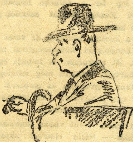
Egy óvatos óbudai

— En ugyan nem ácsorgom itten, majd jövők délután szavazni!