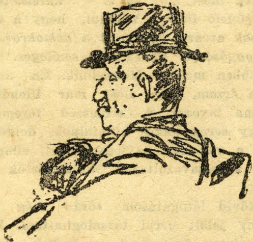
Ahogy mi felszabadítjuk ezt a Budapestet

A Dohány- és Nagydíófa-utca sarkán a Keresztény Kaszinóban van a XIII. kerület pártirodája. Csak úgy zsong benne a permanencia. Küldöncök jönnek, küldöncök mennek, pihegve, ahogy a küldöncnek dukál. Bájos asszonyok-leányok veszik át és dolgozzák föl a körletekből befutó névsorokat. Táviratok röpködnek ki a még nem szavazott késedelmezők után.