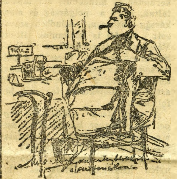
Egy rendíthetetlen Ferencvárosi

A X. választókerületben, melyhez a Terézváros legdemokratább része tar-